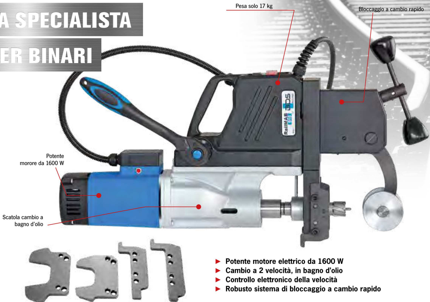
Adattatori disponibili per vari tipo di profilo