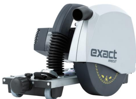
Cod. art. PCP1000