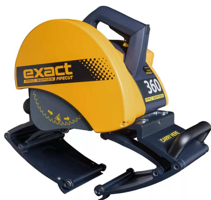
Cod. art. PC360PS

Protezione elettronica da sovraccarichi Indicatore laser di taglio Doppia regolazione per un taglio perfetto