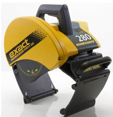
Cod. art. PC280PS

Protezione elettronica da sovraccarichi Indicatore laser di taglio Doppia regolazione per un taglio perfetto